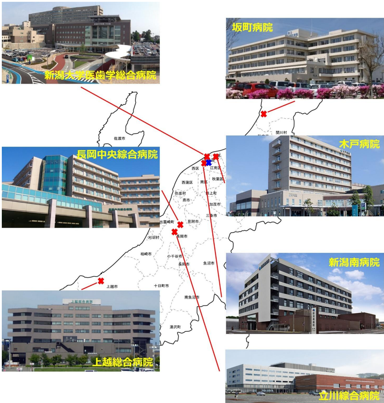
図 2. 各連携施設の位置関係