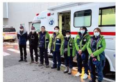
災害派遣医療チームDMAT