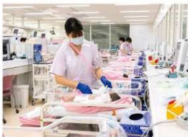
NICU (新生児集中治療室)