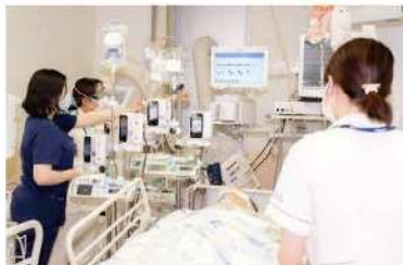
救急看護・集中ケア研修受け入れ

県内のさまざまな現場で交流研修を行うことで、本人のキャリア形成が進み、双方に良い成長効果が生まれます。