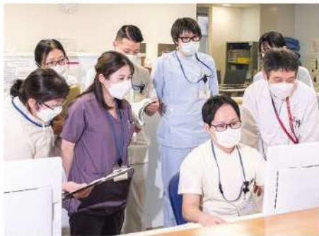
緩和ケアチームラウンド