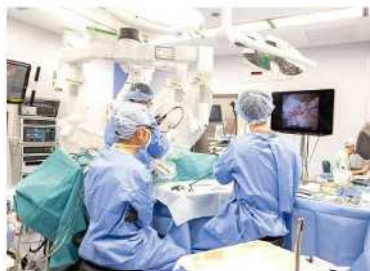
手術支援ロボット「ダヴィンチ」