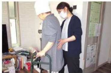
訪問看護ステーションへ