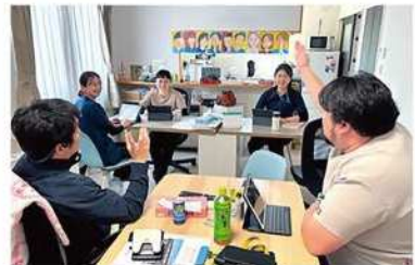
他職種カンファレンス