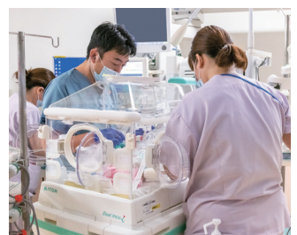
新生児看護 (総合周産期母子医療センター)