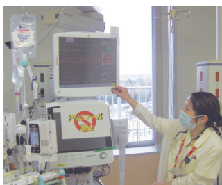
救急看護 (救命救急センター)