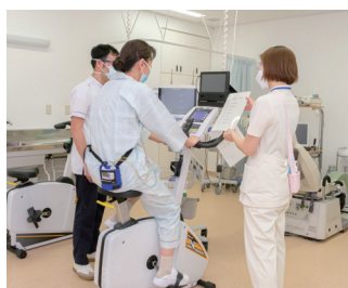
心臓リハビリテーション (外来)