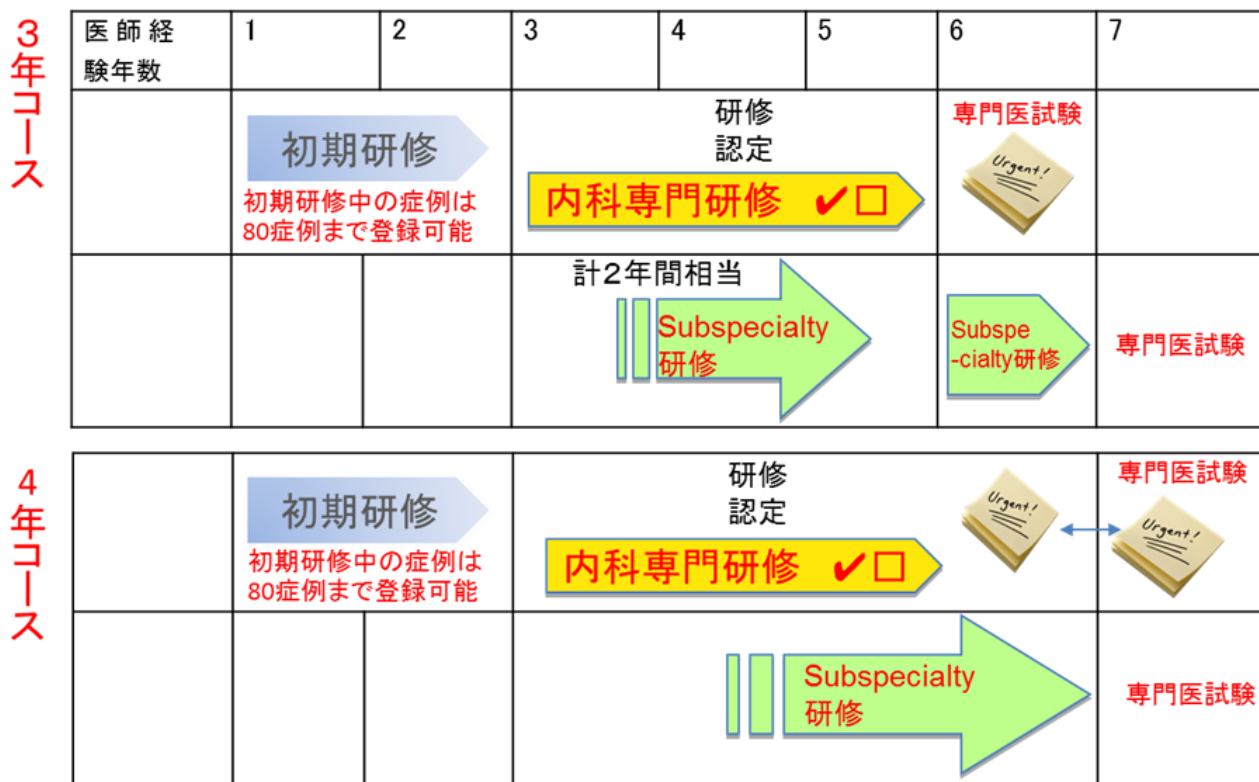
図 1. 内科専門医研修と Subspecialty 研修の並行研修の概念図

4年コースは、前述したように前期2年間は中越医療圏の厚生連長岡中央総合病院、あるいは上越医療圏の厚生連上越総合病院での研修となります。両施設とも、各医療圏の中核病院として、地域のニーズに応えることのできる、地域完結型の急性期医療を提供する医療機関です。また、両施設ともは住居の斡旋が受けられます。