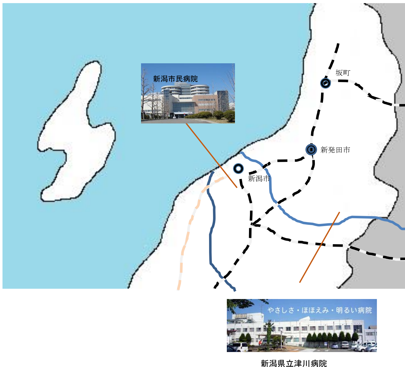
図 1 研修体制

基幹施設と連携施設により専門研修施設群を構成します。体制は図 1 のような形になります。