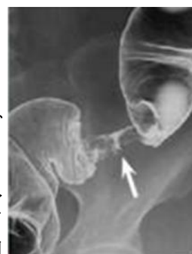
図3 注腸造影でみられた進行がんによる狭窄

さらに、大腸外への病気の広がりや転移の検索のため、CT、エコー、MRI等を行い、病気の進行度(病期・ステージ)を判定します。