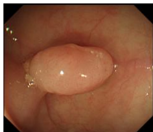
図1 大腸ポリープ (内視鏡)

肛門からバリウムと空気を注入して大腸を膨らませ、体を回転しながら、レントゲン撮影を行い、大腸を調べ